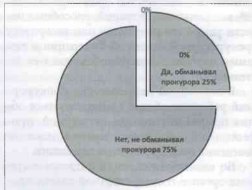
Рис. 3. Случаи сокрытия информации от прокурора со стороны следователей

но скрывали информацию о недостатках и нарушениях в уголовном деле, которые помешали бы утверждению обвинительного заключения. В то же время подавляющее большинство принявших участие в опросе (75%) не признали за собой таких фактов (см. рис. 3).