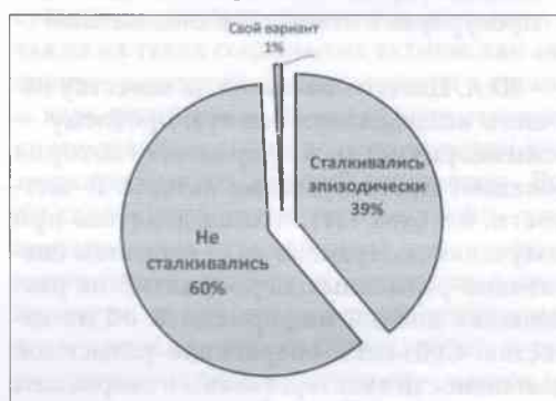
Рис. 1. Сталкивались ли следователи с неэтичным поведением прокурора?

Изначально следует определить наличие и масштаб самой проблемы. Мы выяснили, насколько часто следователи сталкиваются с нарушением этики со стороны прокуроров. Большинство опрошенных (60,2%) дали отрицательный ответ на поставленный вопрос. Однако более трети респондентов (39%) ответили, что такие случаи имели место (рис. 1).